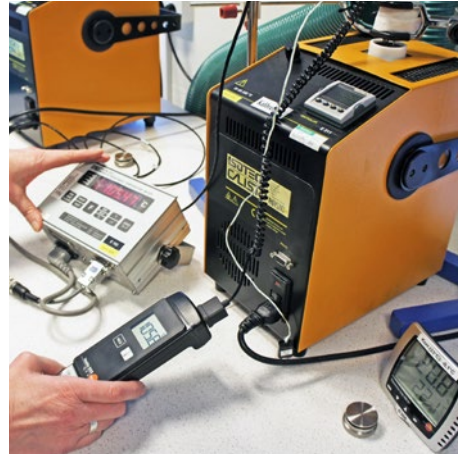
Kalibrering av temperatur i minivätskebad.

I fält använder vi blockkalibrator vilket ger en något sämre noggrannhet, men är behändigare i fält.