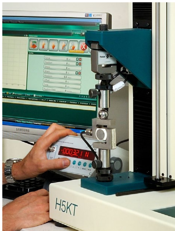
Kalibrering av dragprovare.

Flödesmätare för åldringsskåp och analysinstrument kan vi kalibrera för flöden upp till 20 l/min.