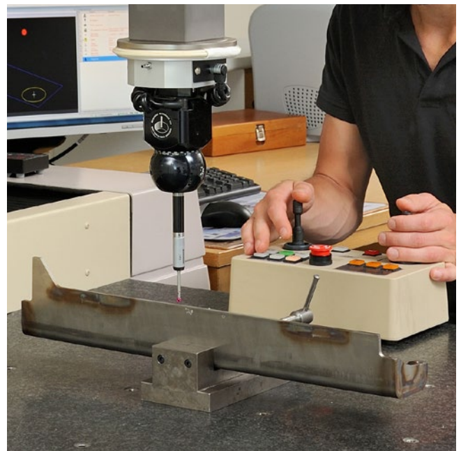
Uppmätning av utfallsprover.

Vi hjälper även till med mätteknisk rådgivning inför mätningar.