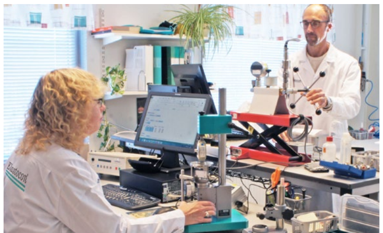
Det allmänna laboratoriet för kalibrering vid 23 °C. Utöver detta har vi ett konstant- rum för kalibrering av längd vid 20 °C ± 0,5 °C, samt ett rum för temperatur- kalibrering.

Mätosäkerheten är den osäkerhet i kalibreringsresultatet som finns efter kalibreringen. Mätosäkerheten beräknas för varje mätsituation. I osäkerheten ingår bl a normalens noggrannhet, det kalibrerade instrumentets upplösning, samt omgivande faktorer som temperatur mm.