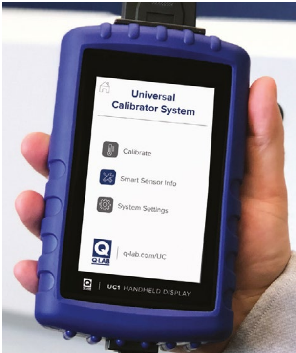
Q-Labs universella kalibratorsystem UC1 är en handhållen enhet för kalibrering av irradians och temperatur i QUV- och Q-SUN-utrustning för väderprovning.

Vi utför kalibrering och service av Q-Labs utrustning för väderprovning hos kunder i Sverige, Norge och Danmark.