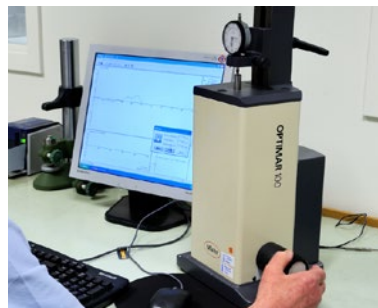
« Klockprovare för mätur.

För att kalibrera skiktjockleksmätare använder vi kalibrerade shims.