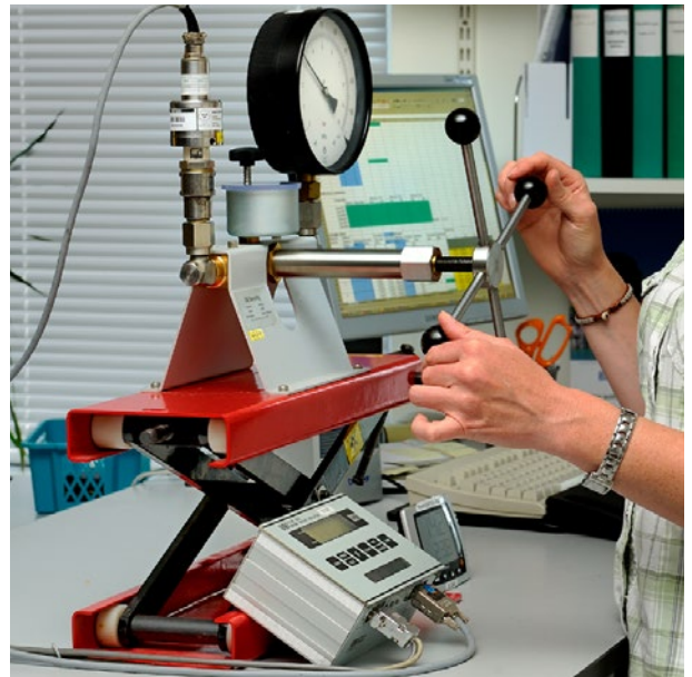
Kalibrering av manometrar.