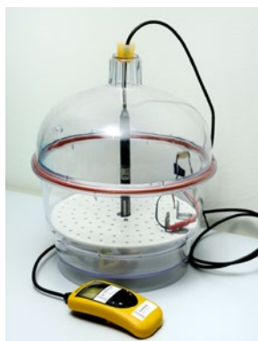
Kalibrering av fuktmatrare.

Hygrometrar kalibrerar vi i vårt laboratorium, medan klimatskåp oftast görs i fält av praktiska skäl.