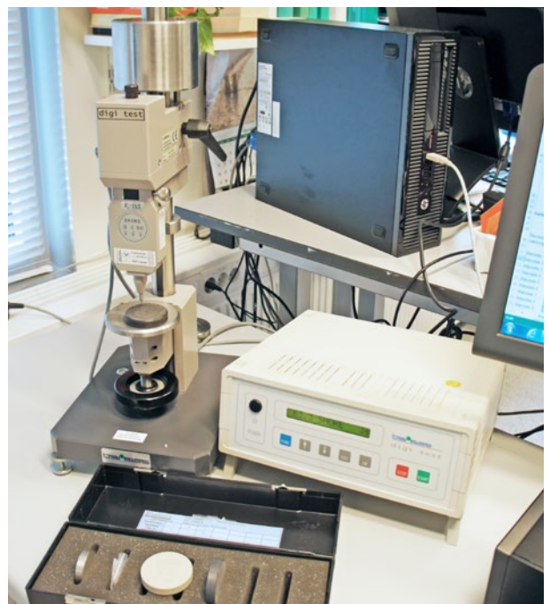
Kalibrering av referensblock.

Referensblock för Shore och IRHD kalibrerar vi i vårt laboratorium.