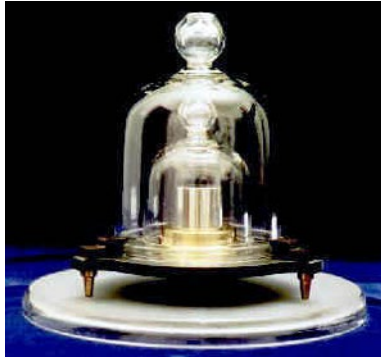
Sveriges rikskilogram nr 40 från 1889.