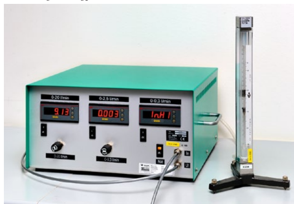
Kalibrering av svävkroppsmätare.