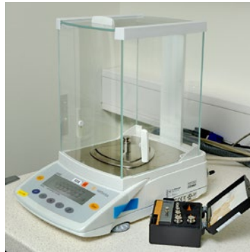
Kalibrering av laboratorievåg.

I samarbete med annat kalibreringsföretag kan vi även erbjuda ackrediterad kalibrering av referensvikter.