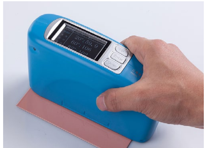
Glansmätaren med olika mätvinklar: 20°/60°/85°.