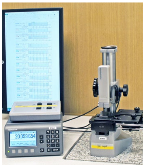
Kalibrering av passbitar i passbitskomparator.

Passbitar, ringar och tolkar kalibreras bara i vårt kalibreringslaboratorium eftersom stora krav ställs på mätmiljö och utrustning.